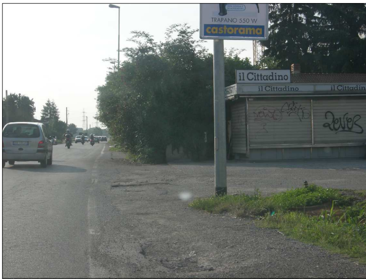
Posizione: SP 13 Tipologia: Impianti Conformi