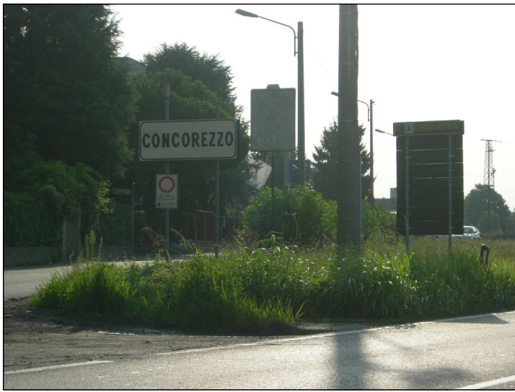
Posizione: Strada provinciale 13 -via S. D'Acquisto Tipologia: Impianti conformi