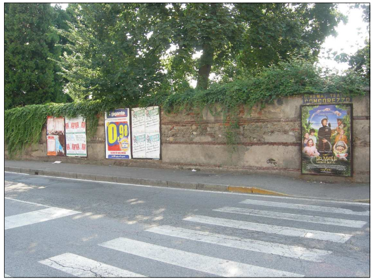
Posizione: Via Dante Tipologia: Impianti Sostituiti