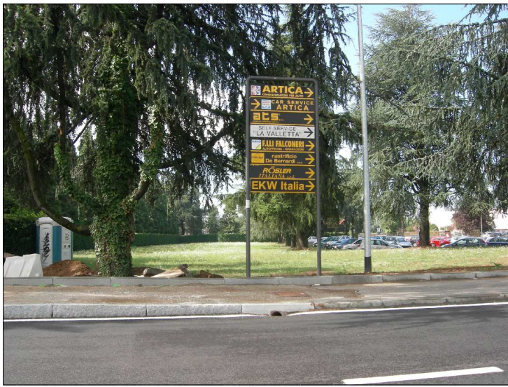
Posizione: Provinciale Monza Melzo Tipologia: Impianti Conformi