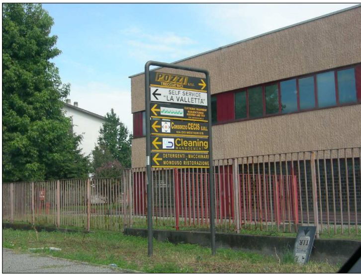
Posizione:?????? Tipologia: Impianti Conformi