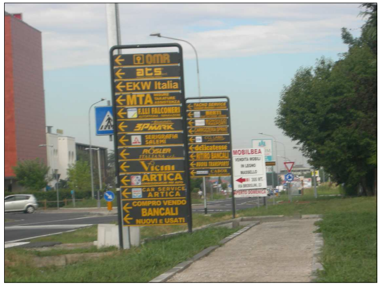
Posizione: Provinciale Monza Melzo Tipologia: Impianti Conformi