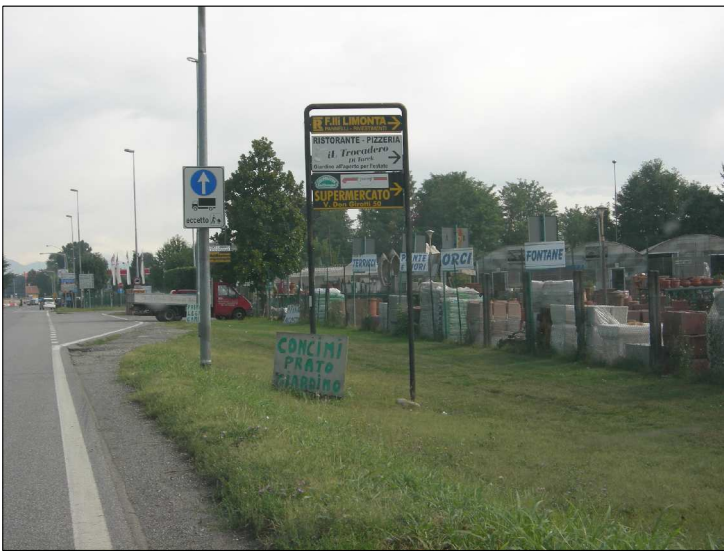
Posizione: Provinciale Milano Imbersago Tipologia: Impianti Conformi