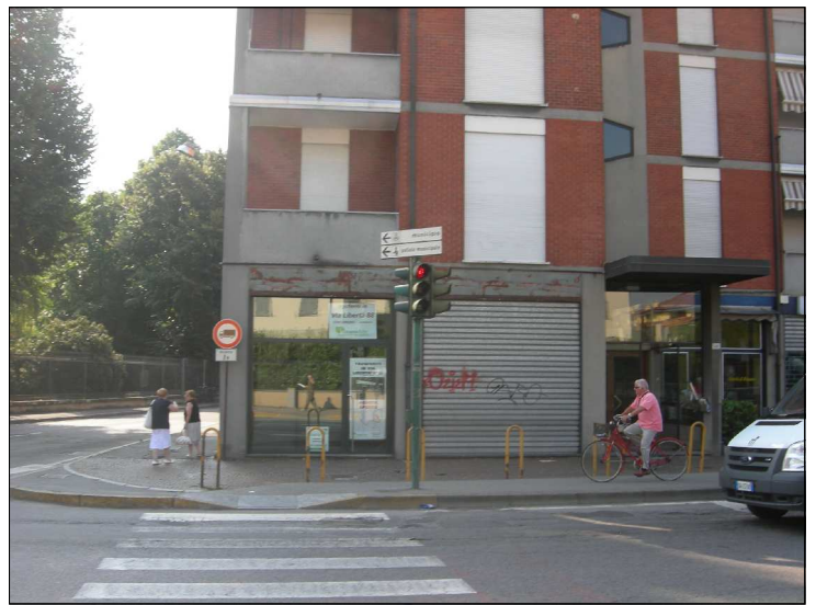
Posizione: Via Dante angolo Via De Capitani Tipologia: Mancante