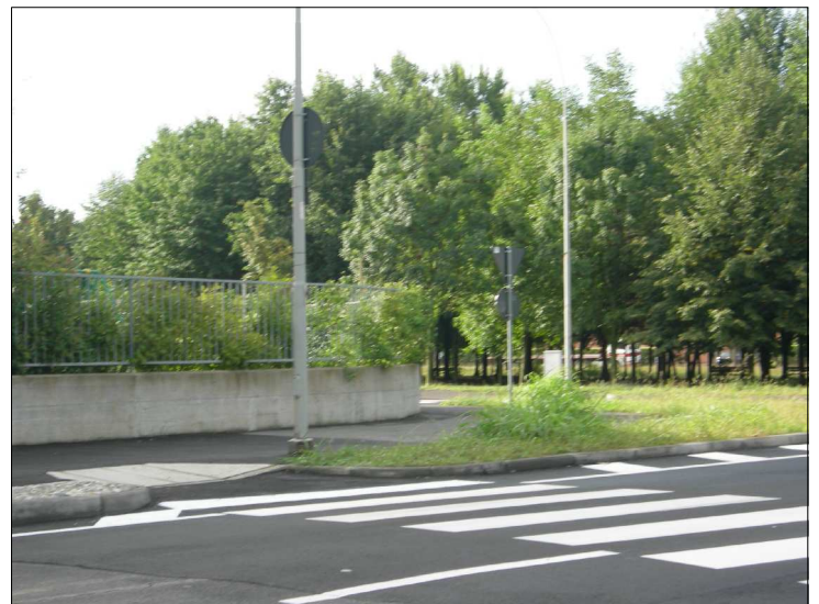
Posizione: Via F. Ozanam Tipologia: Impianti Sostituiti