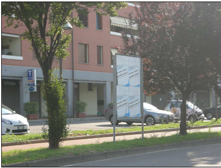
Posizione: Via Monte Rosa Tipologia: Impianti Conformi