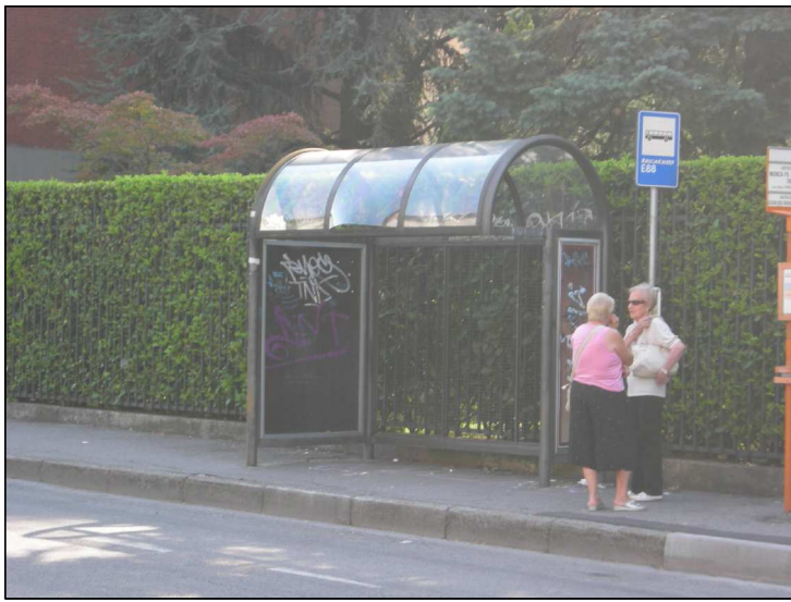
Posizione: Via Dante angolo Via De Capitani Tipologia: Impianti Conformi