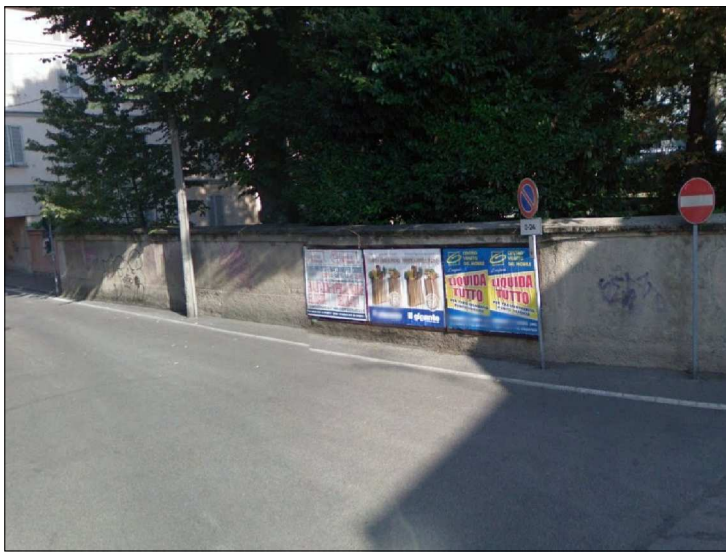
Posizione: Via Paterini Angolo Via Manzoni Tipologia: Impianti Nuovi