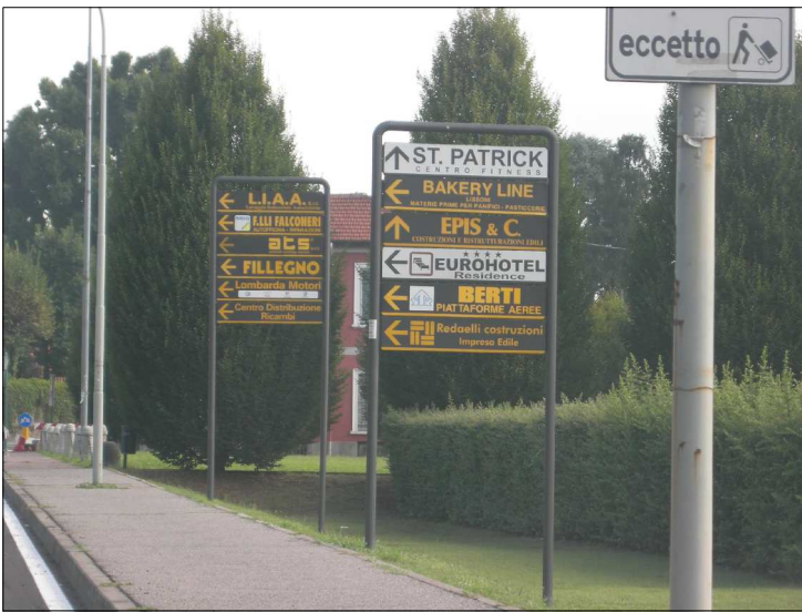
Posizione: Provinciale Milano Imbersago Tipologia: Impianti Conformi