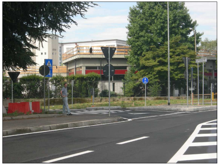
Posizione: Provinciale Monza Melzo Tipologia: Impianti Mancanti