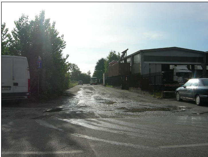
Posizione: Via W. Tobagi Tipologia: Impianti Mancanti e Nuovi