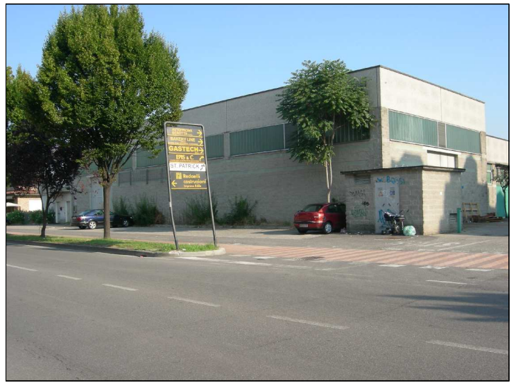
Posizione: Via Monte Rosa Tipologia: Impianti Conformi