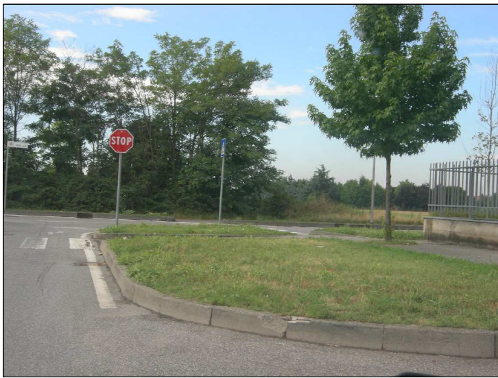
Posizione: Via G. Brodolini Tipologia: Impianti Conformi