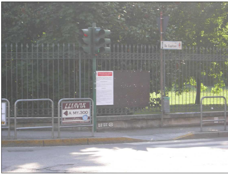
Posizione: Via De Capitani Tipologia: impianto sostituito