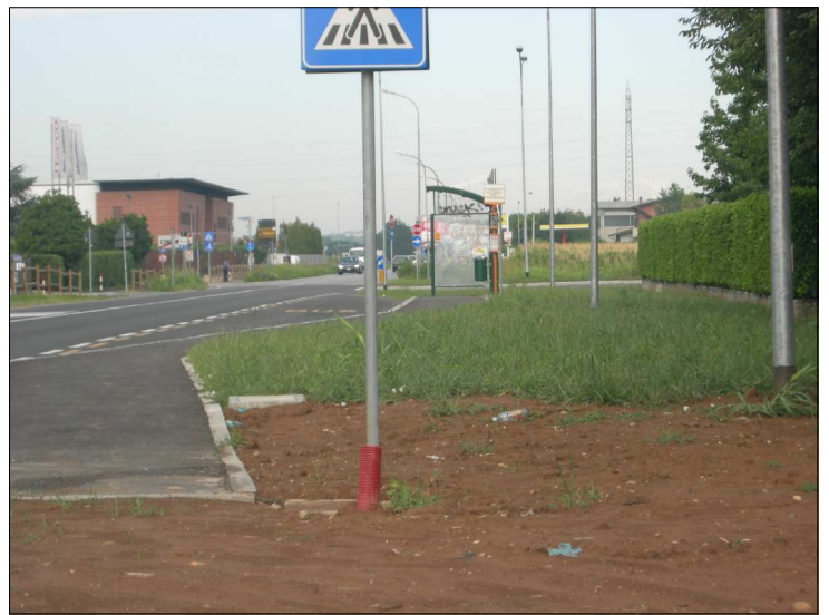
Posizione: Provinciale Monza Melzo Tipologia: Impianti Mancanti