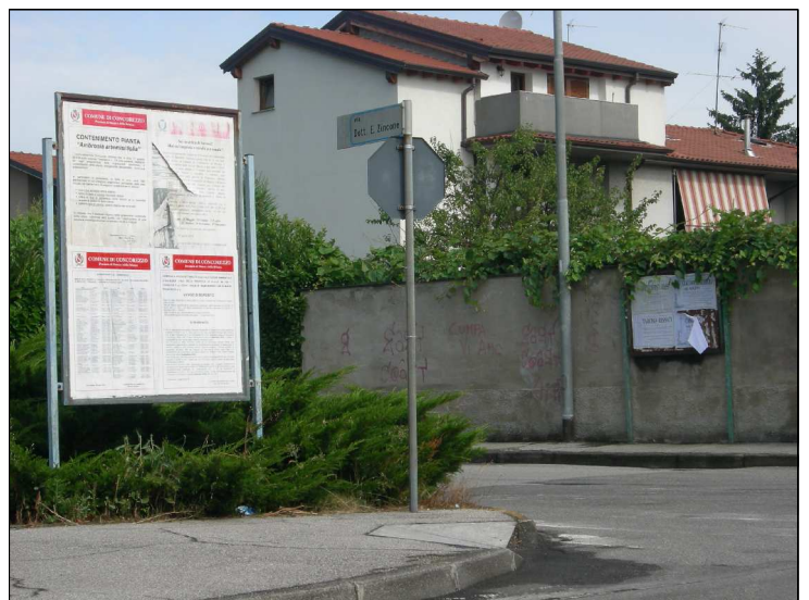
Posizione: Via dott. E. Zincone Tipologia: Impianti Sostituiti