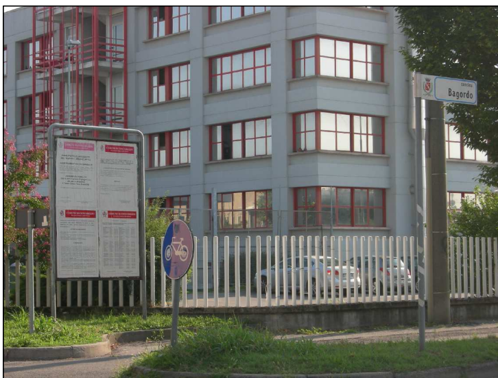
Posizione: Via Monte Rosa angolo Via Bagordo Tipologia: Impianti Conformi