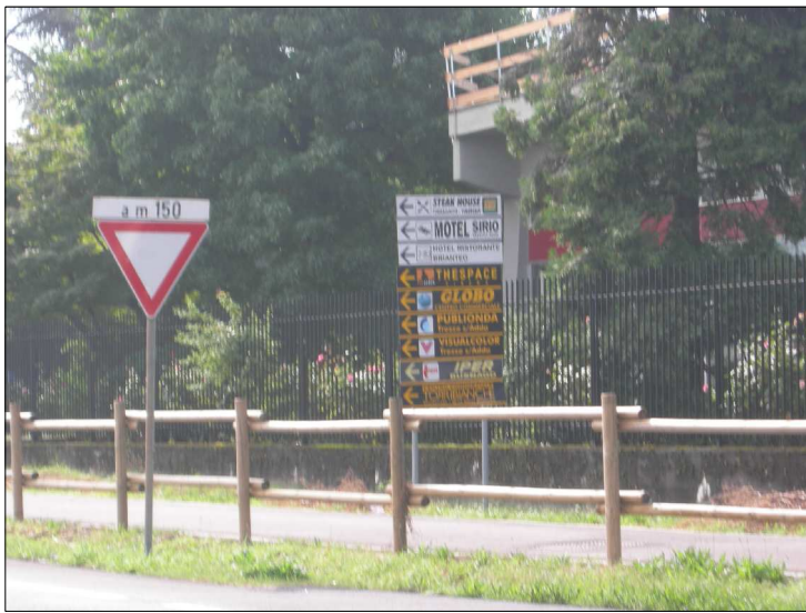
Posizione: Provinciale Monza Melzo Tipologia: Impianti Conformi