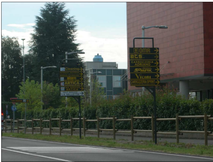
Posizione: Provinciale Monza Melzo Tipologia: Impianti Conformi