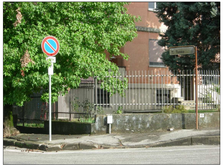
Posizione: Via W. Tobagi Tipologia: Impianti Mancanti