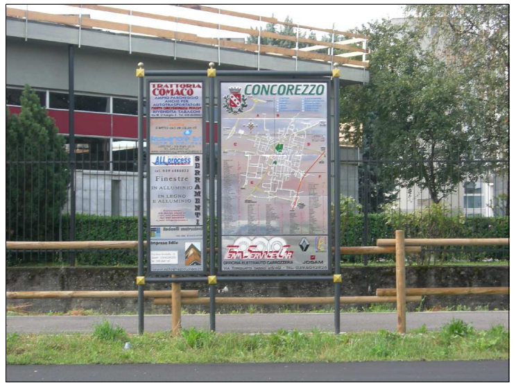
Posizione: Provinciale Monza Melzo Tipologia: Impianti Conformi