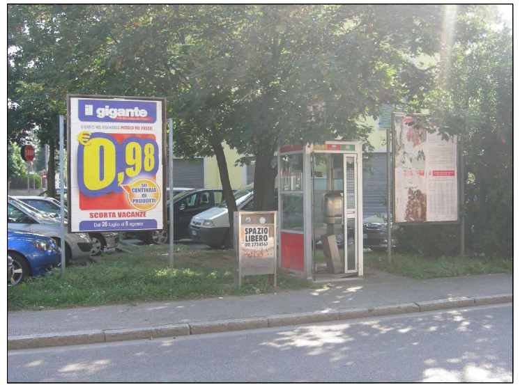
Posizione: Via San Rainaldo Tipologia: Impianto sostituito(44, 176); mancante (228)