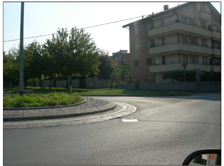
Posizione: Via S. Rainaldo angolo Via Piave Tipologia: Impianti Mancanti