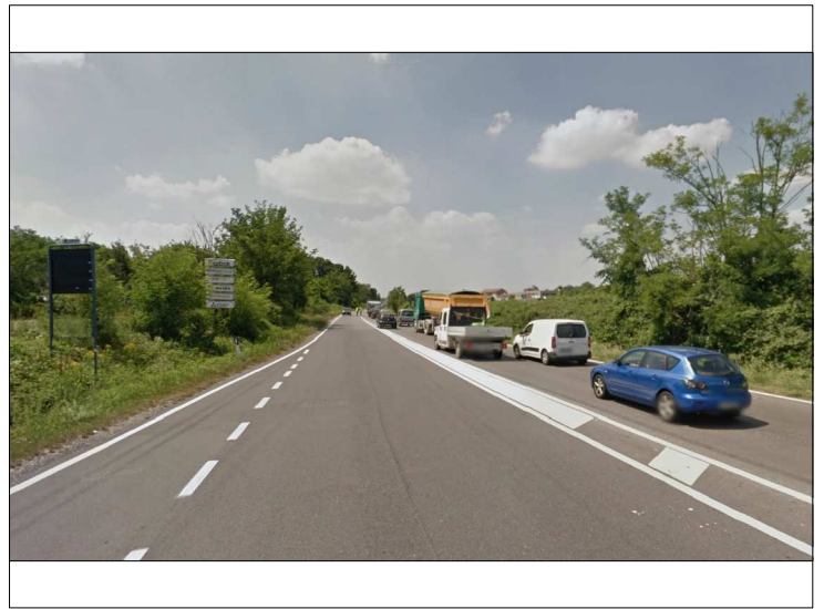
Posizione: Strada Provinciale 13 Tipologia: Impianti Conformi _ provinciali