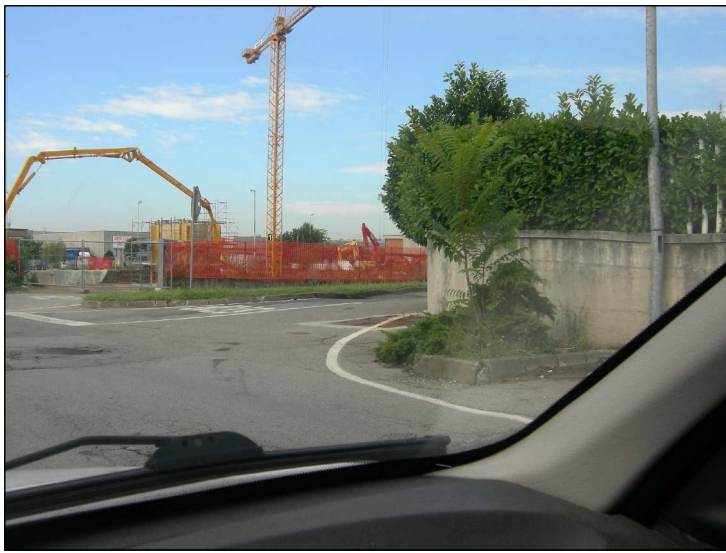
Posizione: Via Vittorio Tipologia: Impianti Conformi