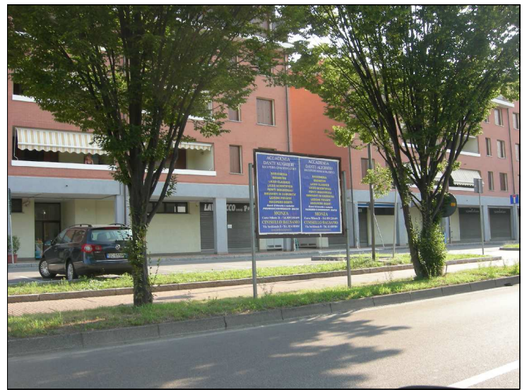
Posizione: Via Monte Rosa Tipologia: Impianti Conformi