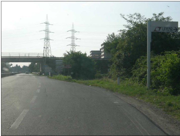
Posizione: Strada Provinciale 13 Tipologia: Impianti Conformi _ provinciali