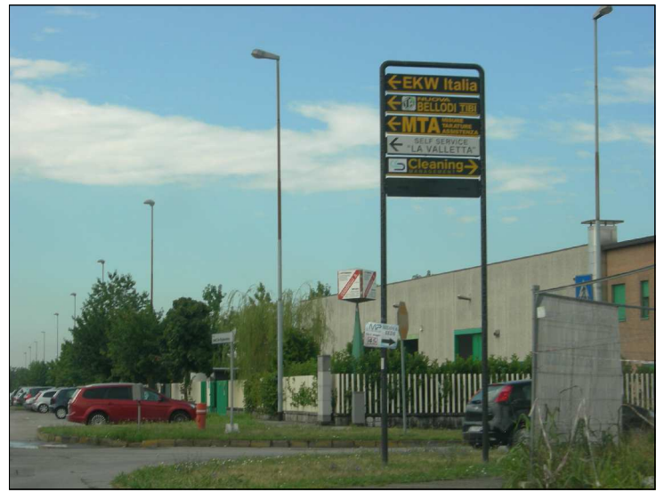
Posizione: Via G. Brodolini Tipologia: Impianti Conformi