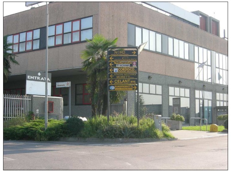
Posizione: Via F. Ozanam -via S. D'Acquisto Tipologia: Impianti conformi