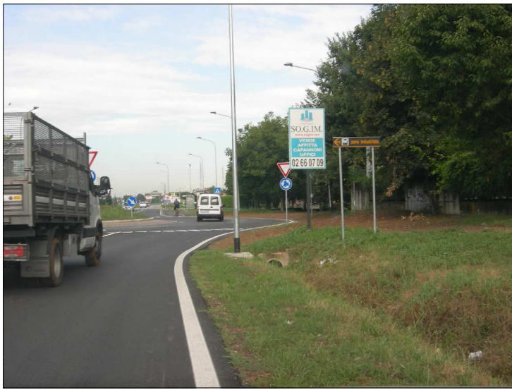
Posizione: Provinciale Monza Melzo Tipologia: Impianti Conformi