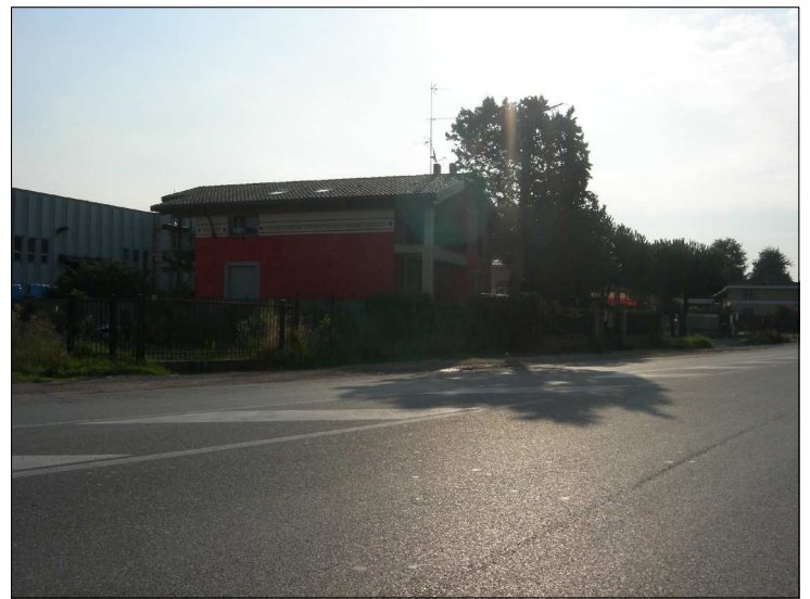
Posizione: Strada provinciale 13 Tipologia: Impianti mancanti