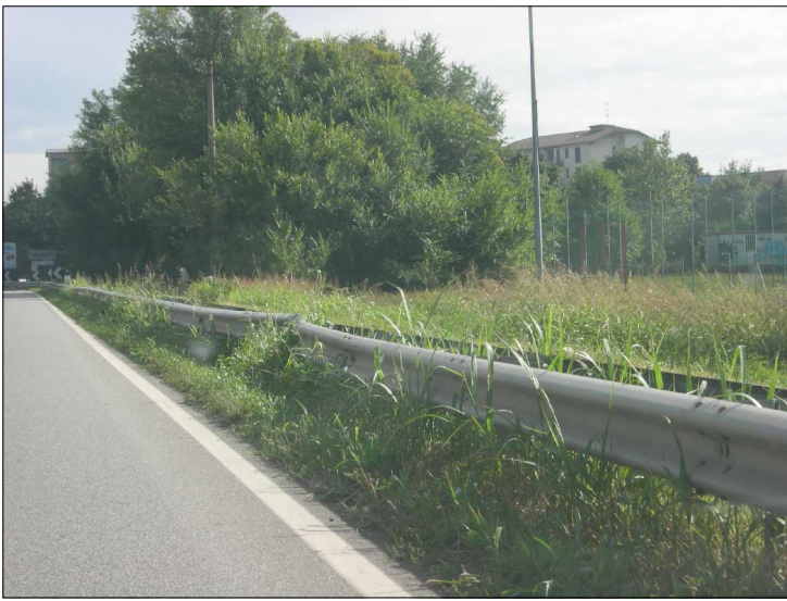
Posizione: Provinciale Milano Imbersago Tipologia: Impianti Mancanti