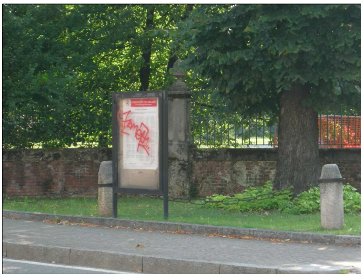
Posizione: Via Dante Tipologia: Impianti Conformi