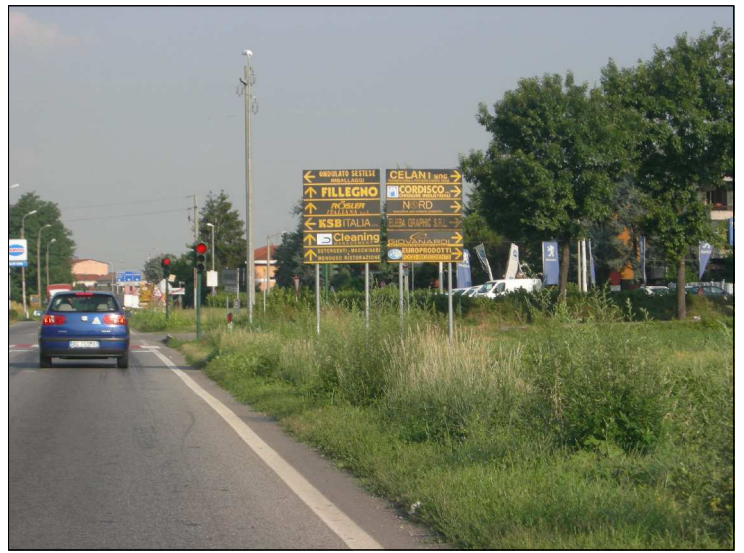
Posizione: Strada provinciale 13 Tipologia: Impianti conformi