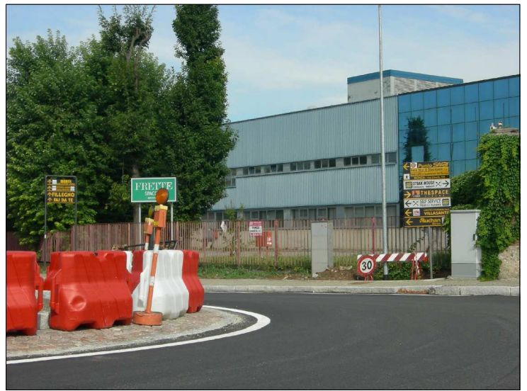
Posizione: Provinciale Monza Melzo Tipologia: Impianti Conformi