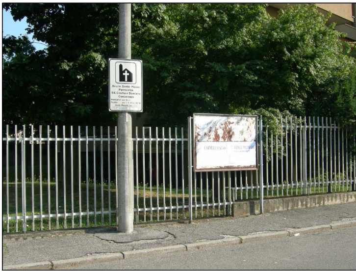
Posizione: Via Garibaldi Tipologia: Impianti Sostituiti