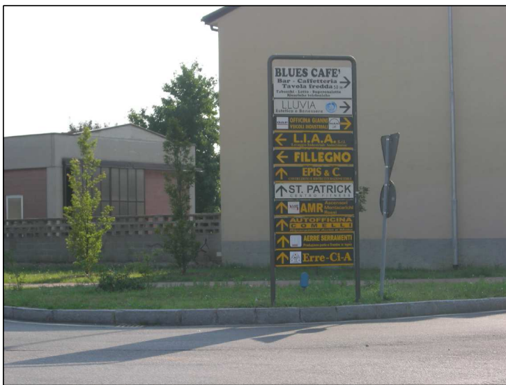
Posizione: Via Monte Rosa Tipologia: Impianti Conformi