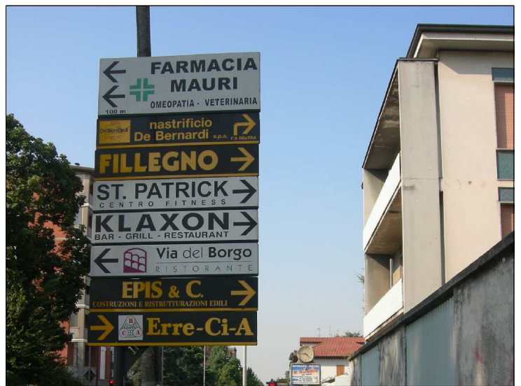
Posizione: Via Dante Tipologia: Impianti Conformi(35); Sostituiti(225,233)