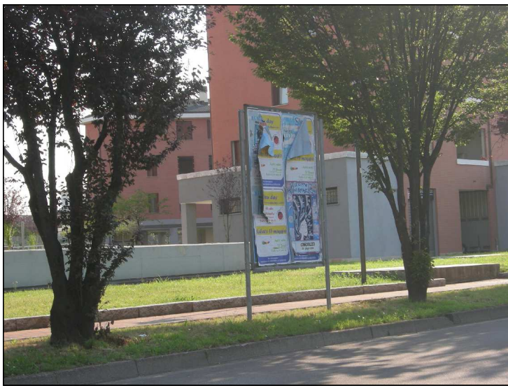
Posizione: Via Monte Rosa Tipologia: Impianti Conformi