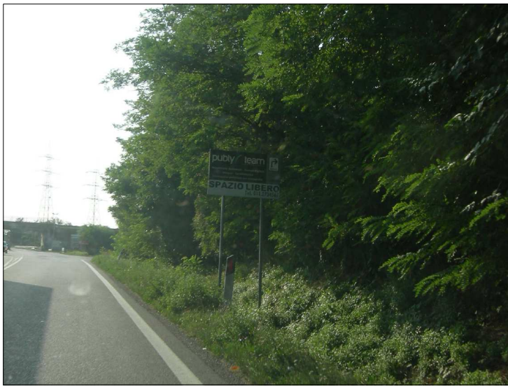
Posizione: Strada provinciale 13 Tipologia: Impianti mancanti