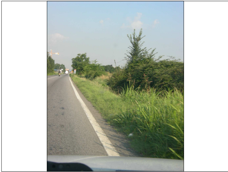
Posizione: Strada provinciale 13 Tipologia: Impianti Mancanti