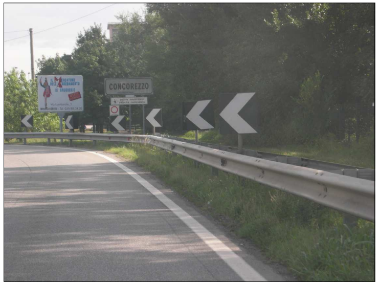
Posizione: Provinciale Milano Imbersago Tipologia: Impianti Mancanti