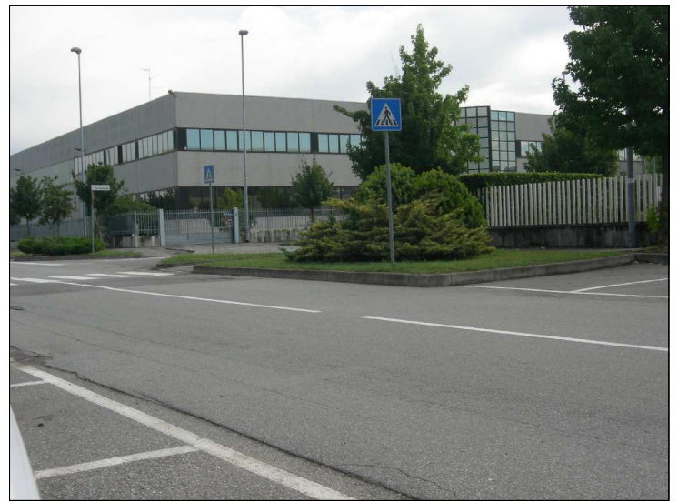
Posizione: Via G. Brodolini Tipologia: mancanti