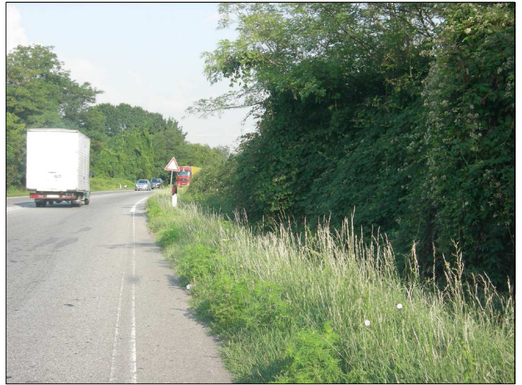
Posizione: Strada provinciale 13 Tipologia: Impianti mancanti