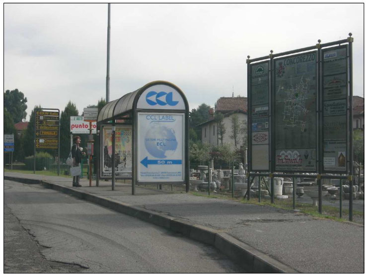
Posizione: Provinciale Milano Imbersago Tipologia: Impianti Conformi e Nuovi