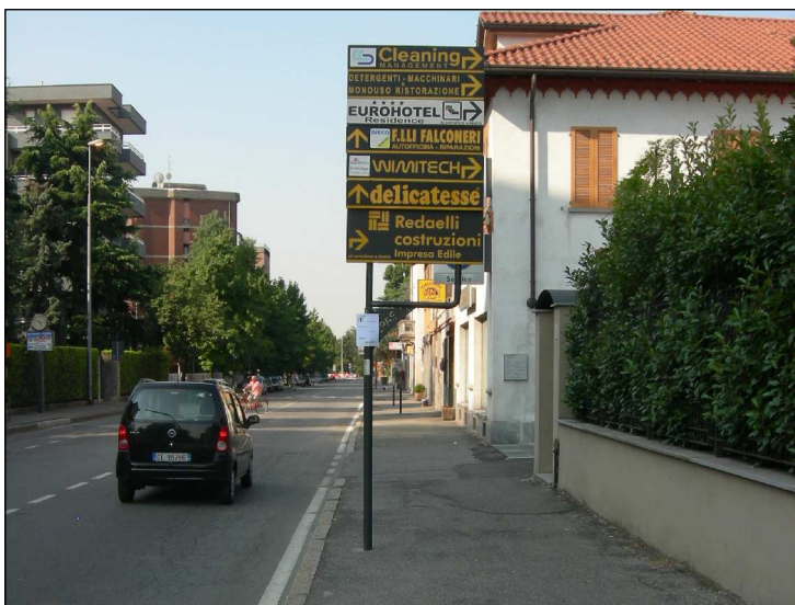
Posizione: Via Dante Tipologia: Impianti Sostituiti e Resi Conformi