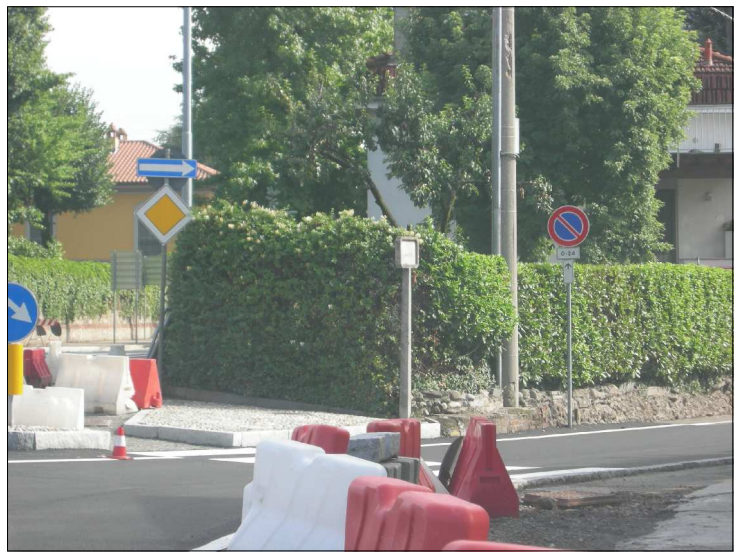
Posizione: Via Dante Angolo Via Manzoni Tipologia: Impianti Mancanti